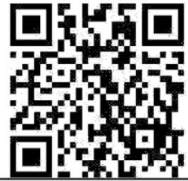
Registration QR Code